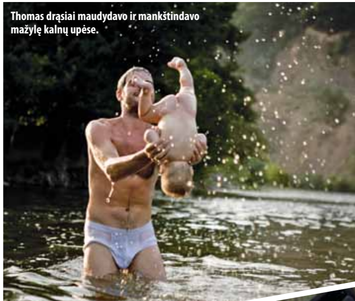
Thomas drąsiai maudydavo ir mankštindavo mažylę kalnų upėse.

mums buvo smagu. Kaip išprotėję susimetėme daiktus ir išlėkėme į Lenkiją (buvo šv. Velykos ir mūsų labai laukė mano tėvai). Tada Lenkijoje viską perpakavome iš naujo, protingiau sudėliojome daiktus. Vis dėlto, manau – mums pasisekė, kad viskas ėjosi kaip iš pypkės. Juk daugumos daiktų, kuriuos pasiėmėme, prieš kelionę net nepatikrinome.