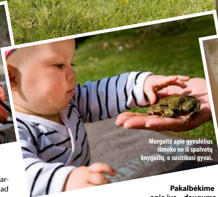
Mergaitė apie gyvulėlius išmoko ne iš spalvotų knygučių, o susitikusi gyvai.