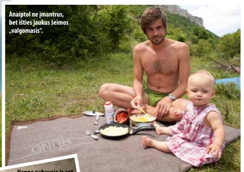
Anaipol net įmanrus, bet ištis jaukus šeimos „valgomas“.