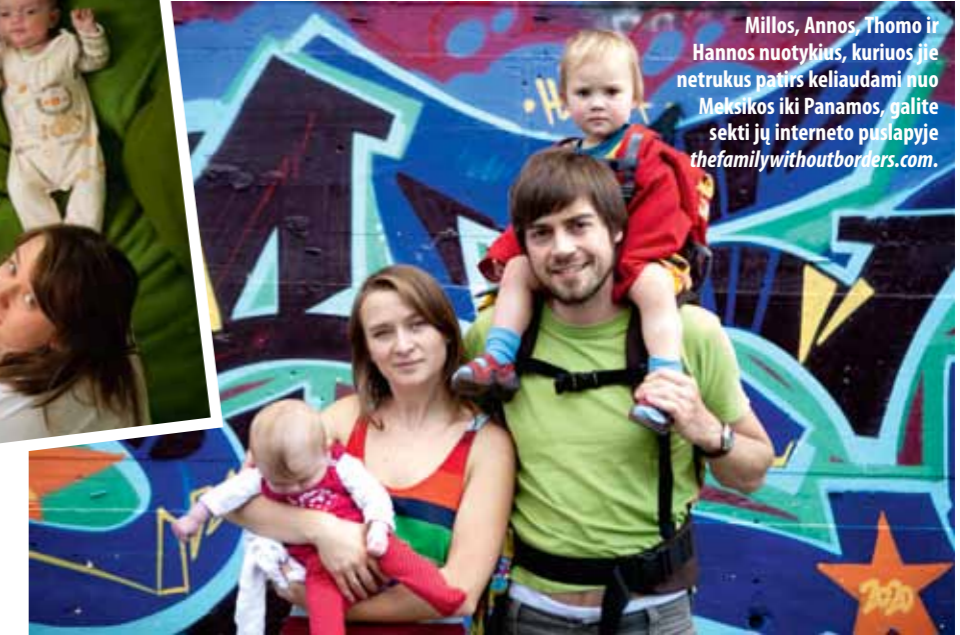
Millos, Annos, Thomo ir Hannos nuotykius, kuriuos jie netrukus patirs keliaudami nuo Meksikos iki Panamos, galite sekti jų interneto puslapyje thefamilywithoutborders.com .

Visą kelionę jaučiausi be galo laiminga ir niekaip negalėjau suprasti, kodėl visi jauni tėvai negalėtų daryti to paties.