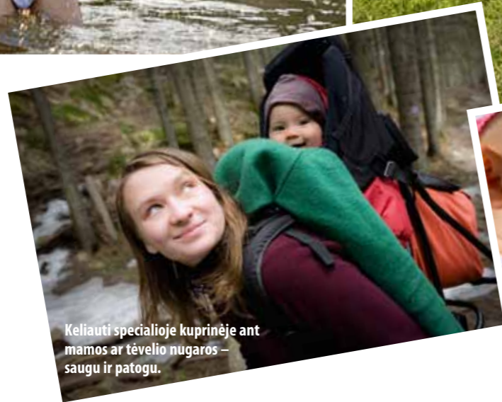
Keliauti specialioje kuprinėje ant mamos ar tėvelio nugaros – saugu ir patogiu.