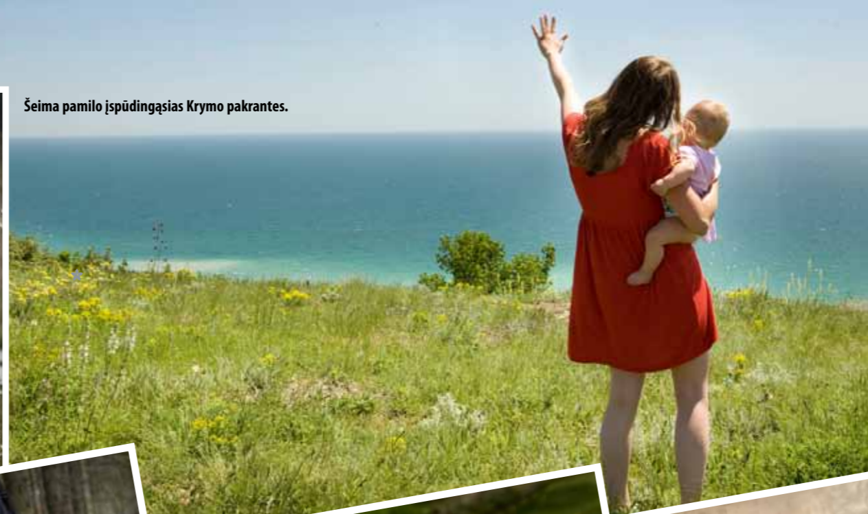
Šeima pamilo įspūdingąsias Krymo pakrantes.